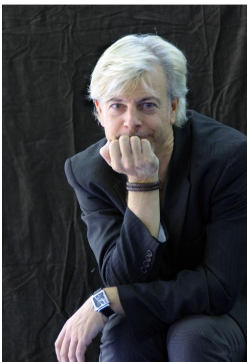
Director General y Coreógrafo

Presidente de la Federación Estatal de Asociaciones de Compañías y Empresas Profesionales de Danza FECED